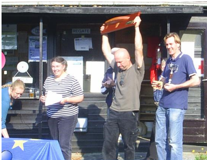
La remise du trophée