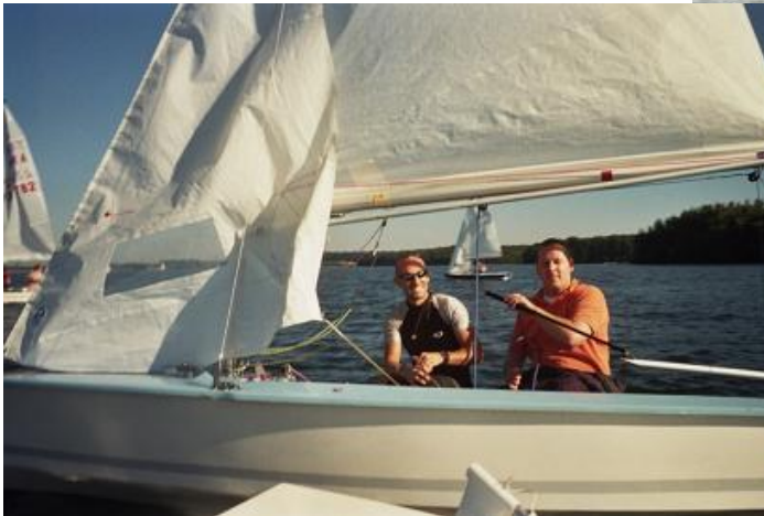
Ils les cachent bien, leurs cannettes...