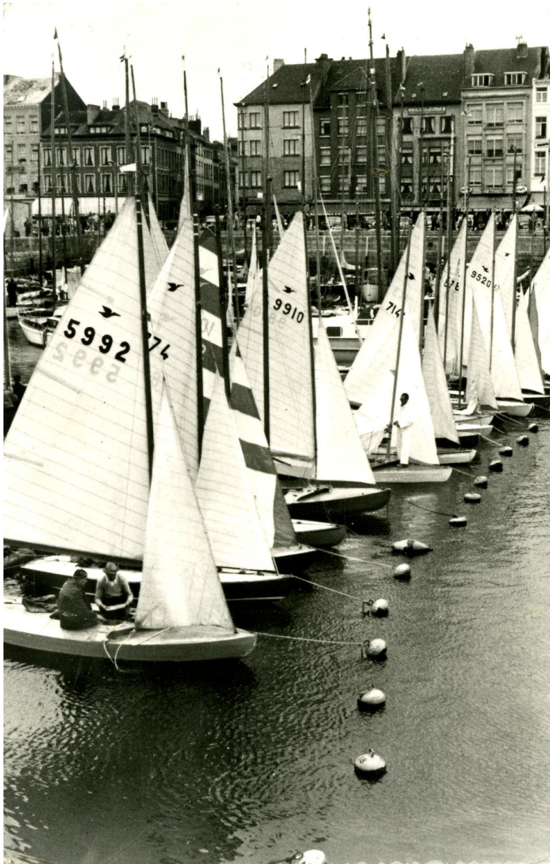
Ed. Prevost , Anvers, 411 Ostende, Yachtclub

Le bassin d'Ostende un jour de régates dans les années 60