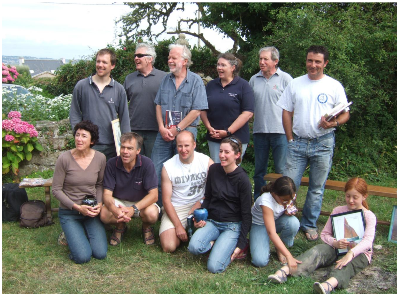
Après la lecture du palmarès

Nous étions peu nombreux mais toutes les ligues étaient représentées !