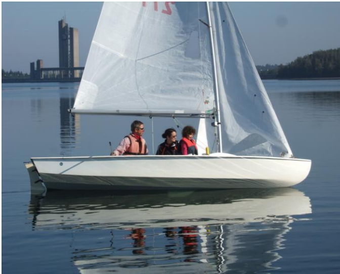
En attendant le vent, entraînement d'une très jeune future équipière