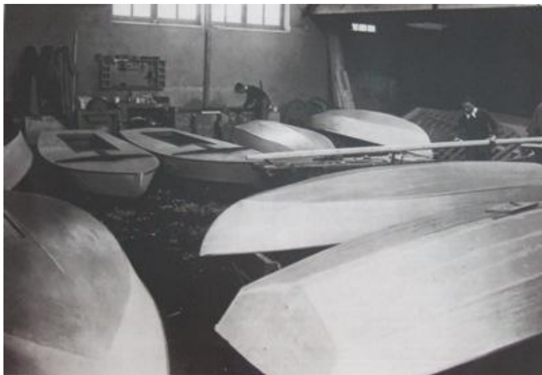
Le « Chantier Nautique » de la famille Pichavant à Pont l'Abbé en pleine activité dans les années 60