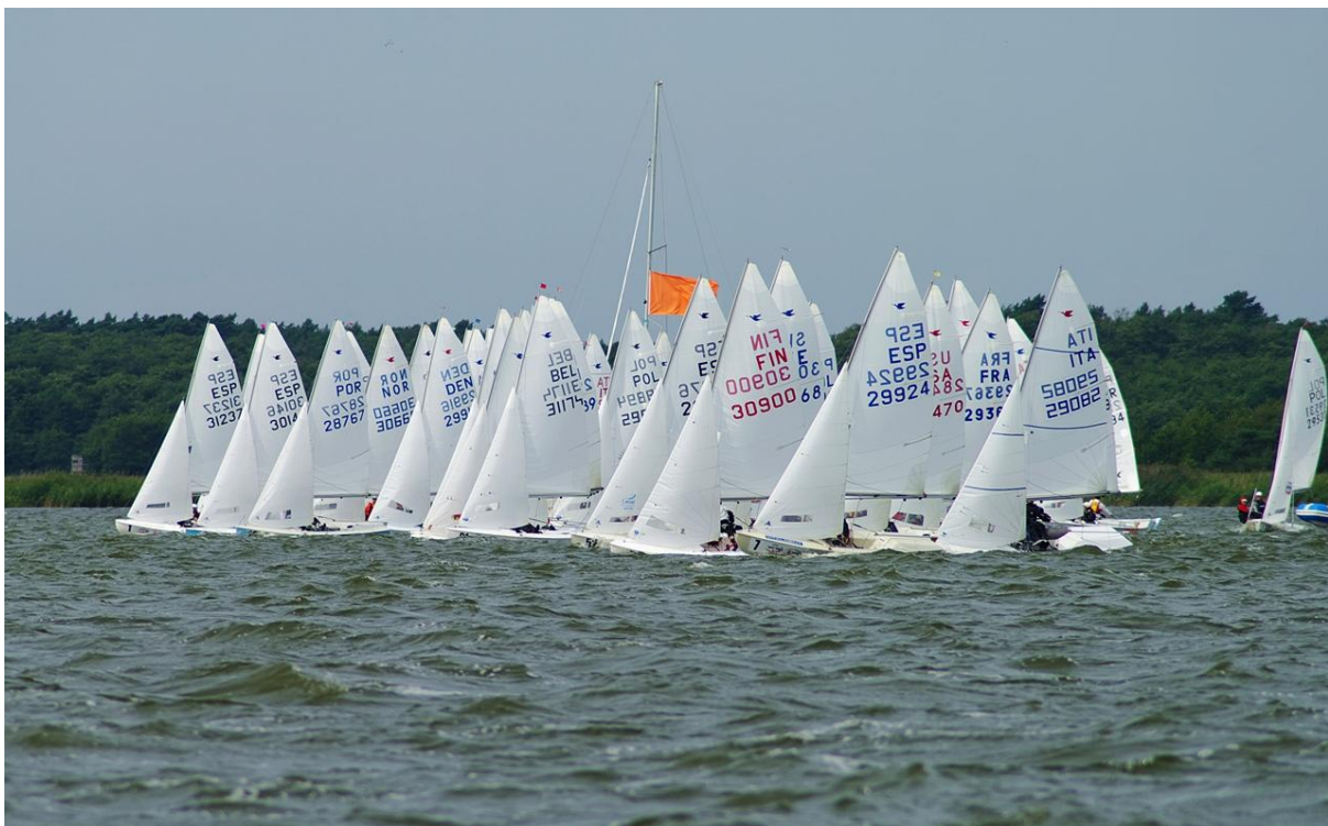
Un départ

Notre éminent Snipiste-essayiste étant parti promouvoir la cause Snipiste au Turkmenistan, nous n'avons depuis pas pu le joindre pour finir sa version. Nous dénigrons par avance toute thèse conspirationniste à ce sujet. La rédaction.