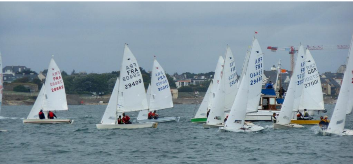
Sur la ligne