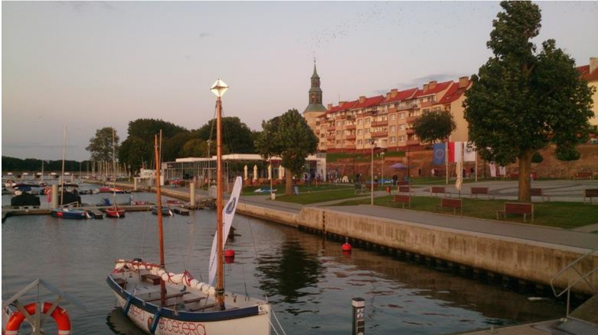
Le port, l'église...

16/08 , Récupération de l'équipière (presque à l'heure) sur une aire d'autoroute puis direction la Pologne (au programme : 1800km de route, 24H de trajet en tenant compte d'une nuit un peu courte...). Passage par la Belgique (ses autoroutes en travaux, 1 seule file sur des dizaines de kilomètres), l'Allemagne de l'ouest (son currywurst réchauffé au micro-onde dans une station service à 22H30, nous déconseillons vivement !!), l'Allemagne de l'Est (ses tronçons d'autoroute totalement défoncés où on roule à 30km/H de peur de défoncer le bateau) et enfin la Pologne (nous sommes maintenant le 17/08)!! Passage des différentes frontières sans le moindre contrôle, mais on ne va pas s'en plaindre.